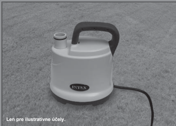
Len pre ilustratívne účely.

Nezabudnite vyskúšať iné vynikajúce výrobky Intex: Bazény, bazénové príslušenstvo, Nafukovacie Bazény a DoMÁce Hračky, Nafukovacie matrace a Č, ktoré sú k dispozícii u vynikajúcich predajcov alebo navštívte naše webové stránky uvedené nižšie.